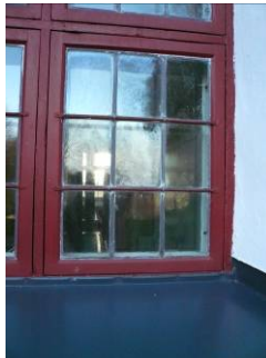
B 11 – Detalj av fönster i norra fasaden