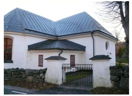
B 03 – Östra portalen, kyrkan och sakristian fr. NO