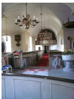
B 09 – Långhsuet fr. koret i O