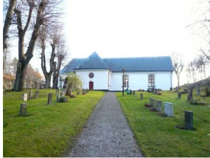
B 05 – Kyrkan och nya delen av kyrkogården fr. N