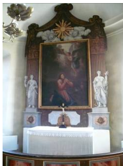
B 16 – Koret m. altaruppsatsen