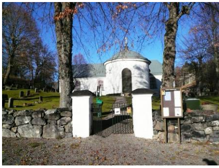
B 01 - Kyrkan och gravkoret fr. S