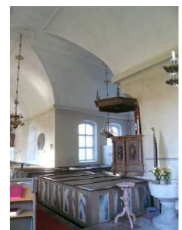
B 10 – Norra korsarmen och predikstolen fr. SO