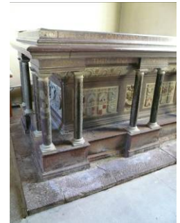
B 12 – Stureska gravén i södra korsarmen fr. NO