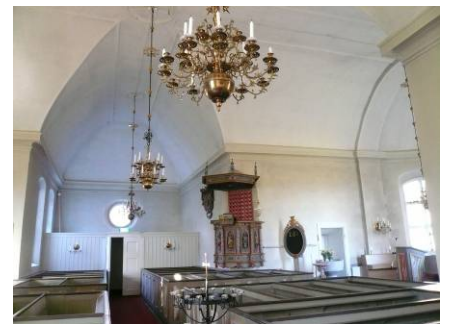
B 13 – Norra korsarmen fr. S