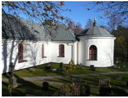
B 02 – Kyrkan, gravkoret och södra delen av kyrkogården fr. SV