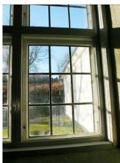
B 08 – Detalj fönster fr. insidan