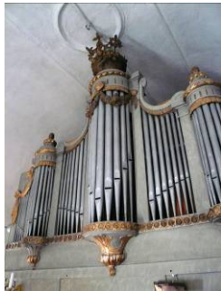
B 07 – Orgelfasaden fr. 1790