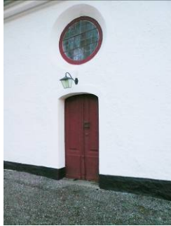
B 04 – Norra ingången i norra korsarmen fr NV