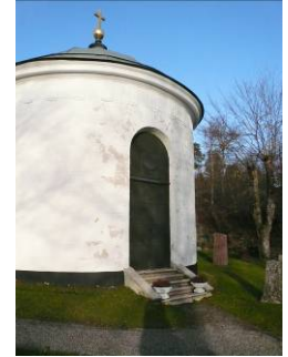
B 06 – Bondeska gravkoret fr. SV