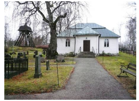
B 03 – Södra sidan med vapenhuset fr. S