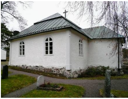
B 01 – Västra sidan med vapenhuset fr. SV