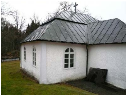
B 7 - Koret sett fr. O