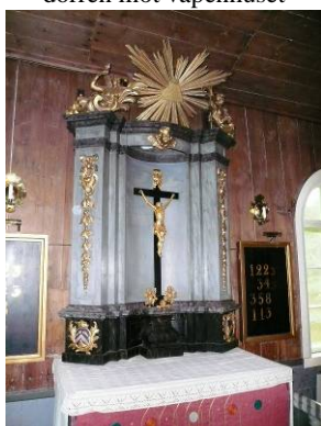
B 12 – Altarprydnaden fr. 1743