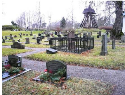
B 05 – Kyrkogården med klockstapeln fr. O