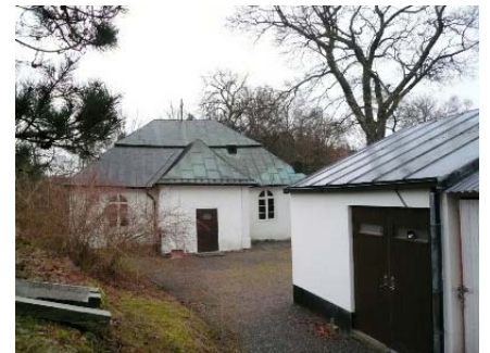
B 8 – Norra sidan med sakristian, i förgrunden bårhuset