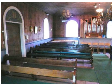
B 9 – Kyrkorummet mot väster. Till vänster dörren mot vapenhuset