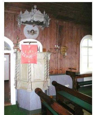
B 14 – Predikstolen fr. 1600-talet senare del