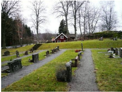
B 04 – Kyrkogården mot sydväst