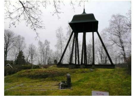
B 06 – Klockstapeln fr. O