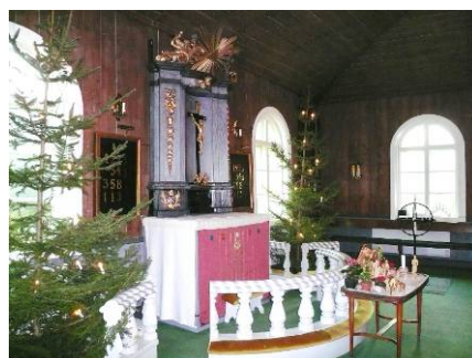
B 13 – Koret med altaruppsatsen