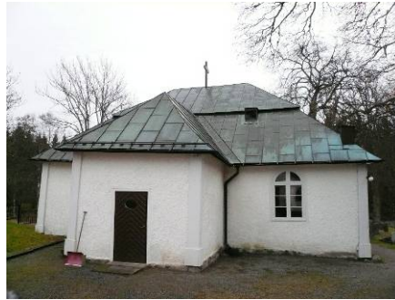
B 02 – Norra sidan och sakristian fr. N