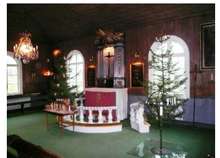
B 11 – Koret mot NO