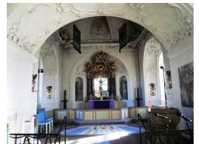
B 12 – Högkoret fr. 1690-talet; fr. V