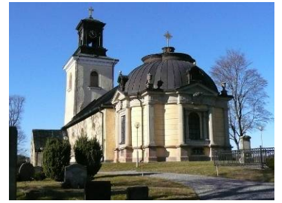
B 06 – södra sidan med koret; fr. SO