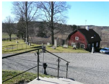
B 08 – Del av kyrkbacken m. klockarbostaden, fr. O