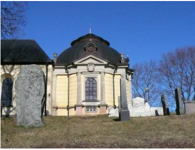
B 04 – Långhuset med Dahlbergska gravkoret i östra förlängning; fr S