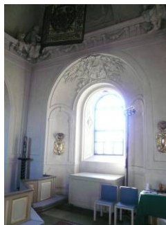
B 11 – Södra fönsternischen i högkoret