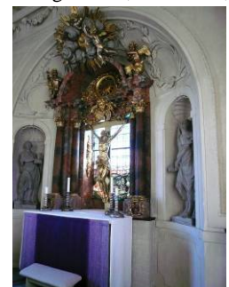
B 15 – Högkoret fr. 1690-talet