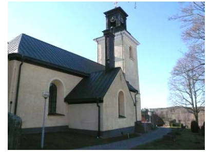
B 03 – Norra sidan med sakristian, fr. NO