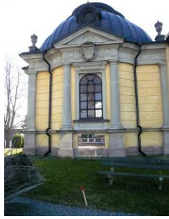
B 05 – Dahlbergska gravkorets östra fasad; fr. O