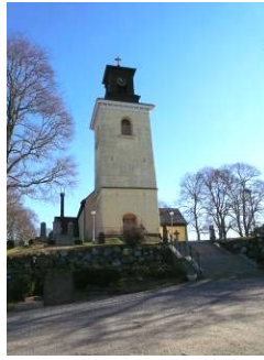
B 02 – Kyrkan sedd fr. kyrkbacken, fr. V