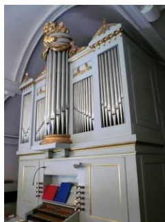
B 14 – Orgeln med fasad fr. 1795