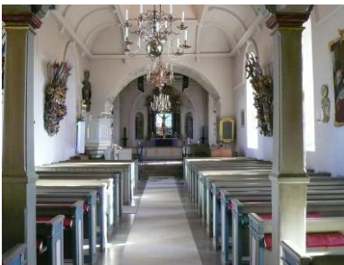
B 07 – långhuset med högkoret, fr. V