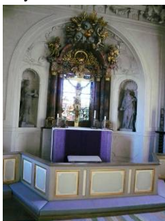
B 13 – Koret m. altare, altarprydnad och altarri