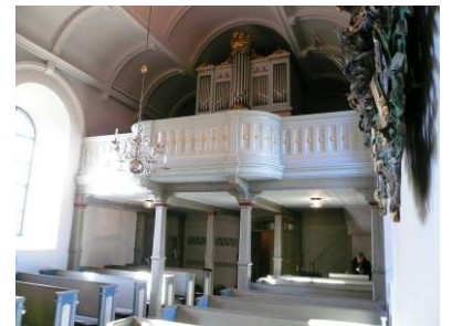
B 09 – Orgelläktaren m. barriär fr. 1890-talet, fr. O