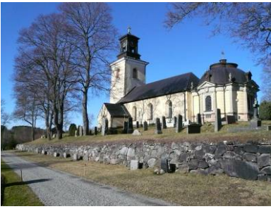
B 01 – Kyrkans södra sidan och den äldre del av kyrkogården, fr. SO