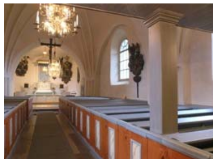
B 08 – Kyrkorummet med koret i öster