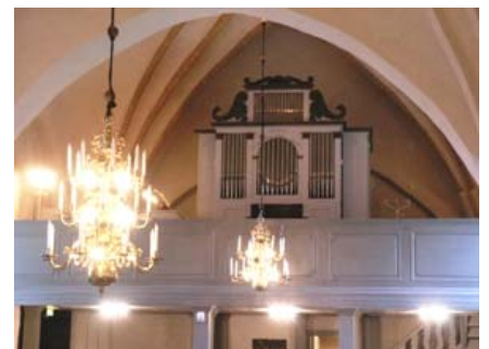
B 10 – Orgelläktaren