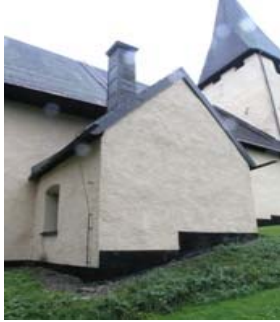
B 02 – Sakristian och tornet fr NO