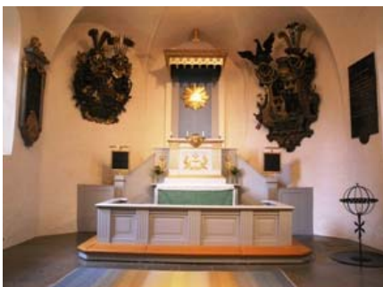
B 09 – Koret