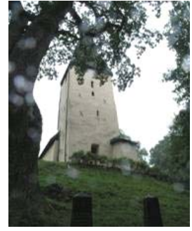
B 07 – Tornet fr. V