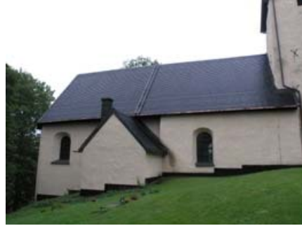
B 05 – Norra långsidan fr. N