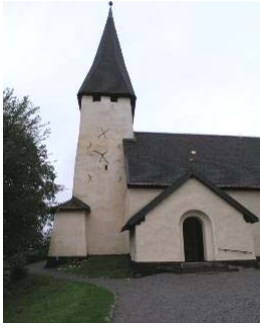
B 01 - Tornet och vapenhuset fr. S