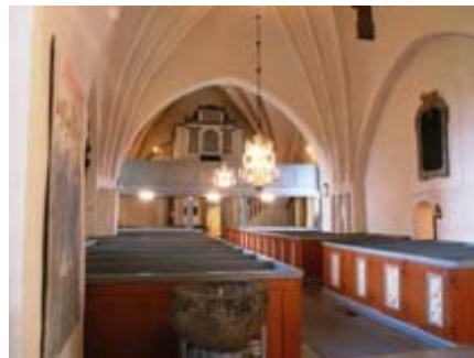
B 16 – Kyrkorummet med orgelläktaren i V