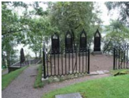
B 17 – Familjgrav i norra delen av kyrkogården