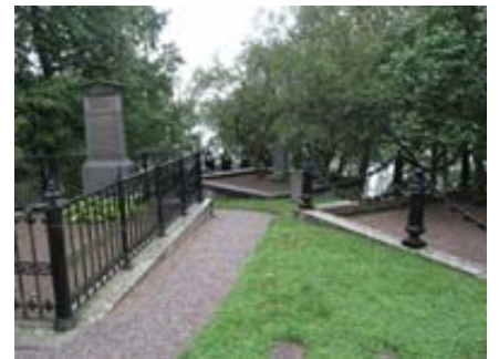
B 12 – Gravar i norra delen av kyrkogården