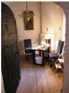
B 14 – Sakristian