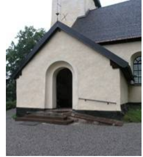
B 06 – Vapenhuset fr. SO