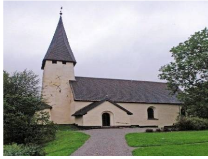
B 02 -Kyrkan fr. S