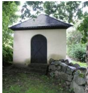
B 11 - Benhuset fr. N